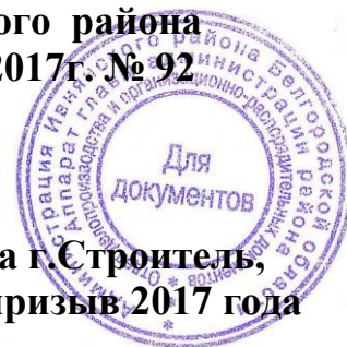
ГРАФИК работы призывной комиссии военного комиссариата г.Строитель, Яковлевского и Ивнянского районов на весенний призыв 2017 года