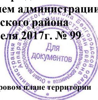
Схема расположения многоконтурного земельного участка на кадастровом плане территории